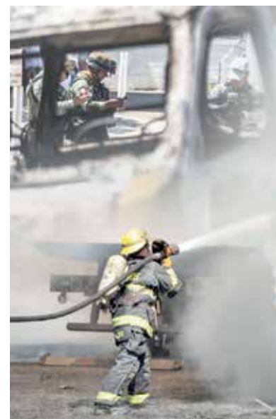
Oleada de incendios

De acuerdo con la dependencia federal, esta operación militar contó con “coordinación y cooperación bilateral” de Estados Unidos, que proporcionó información complementaria de inteligencia.