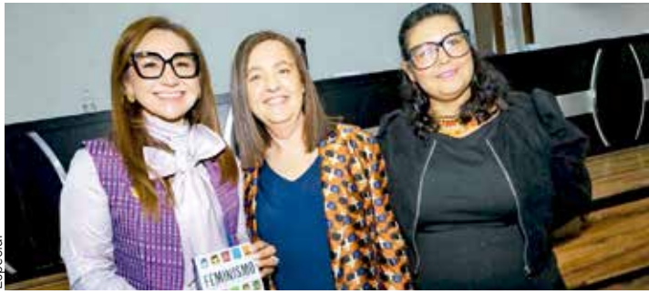
Alianza Suscriben convenio por una Comunicación libre de violencia contra las mujeres P.5