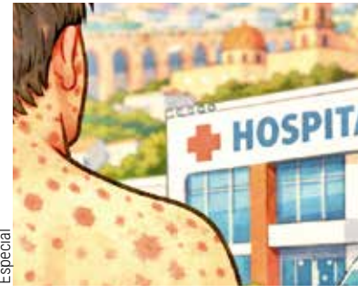
Salud Confirman un caso más de sarampión en Querétaro; suman 23 en 2026 P.2