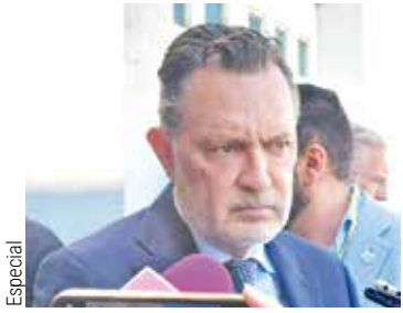
Obra Kuri destaca construcción del puente de Castillo P.3