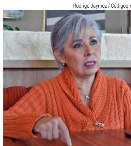
Rodrigo Jaymez / Códigoqro

“Creo que este tipo de iniciativas al final de cuentas no tienen un propósito o son casi imposibles de cumplir. Mi primera pregunta es ¿cómo va a hacer que regrese a México?, un tratado de extradición jamás va a funcionar. Cuando una persona en esa