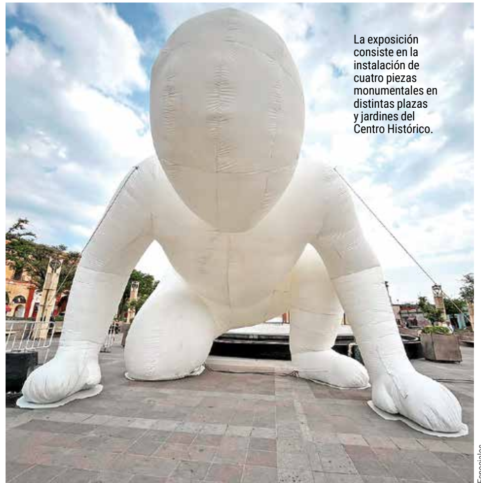
La exposición consiste en la instalación de cuatro piezas monumentales en distintas plazas y jardines del Centro Histórico.