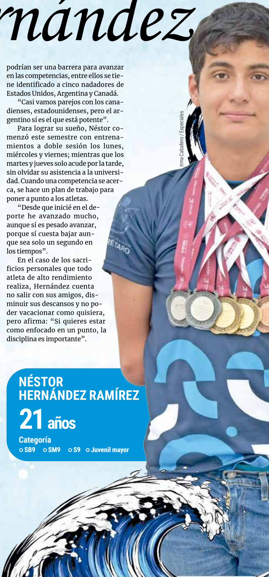
Irma Caballero / Especiales